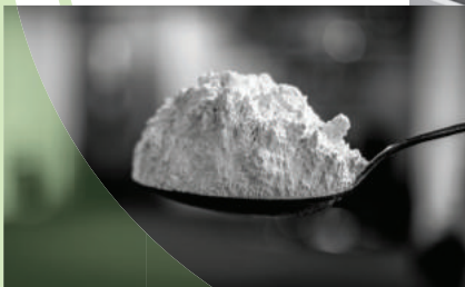
Obr.2 Unikátní brusný prášek Farécla